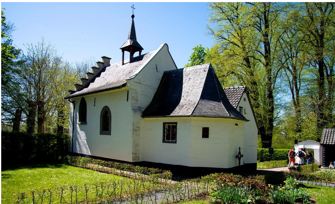
De Kapel van De Kluis.

Daarna werden de ramen van tralies voorzien, de deursloten verstevigd en kwam er een tweede kluizenaar wonen. Samen hebben zij een vluchtgang gegraven naar het talud, even ten zuiden in het bos, waardoor zij bij een overval konden vluchten.