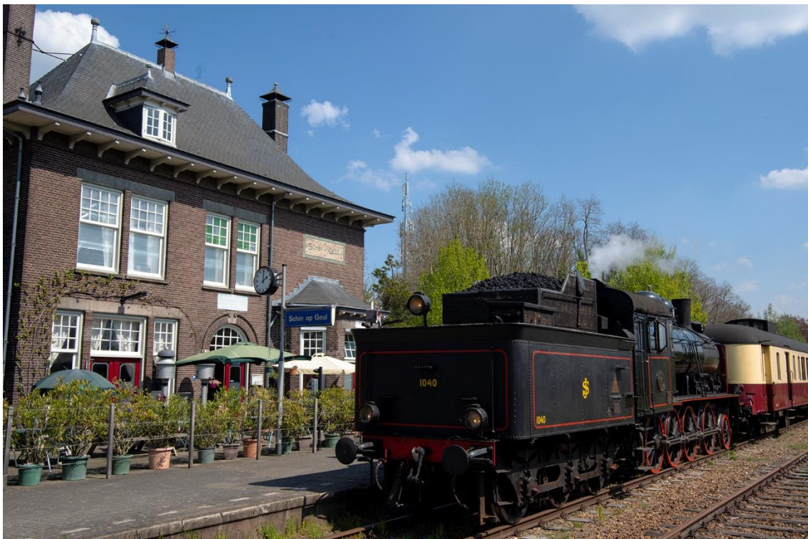
Aankomst op station Schin op Geul.