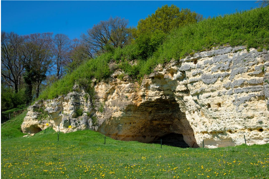
Uitzicht op de Döölkesberg