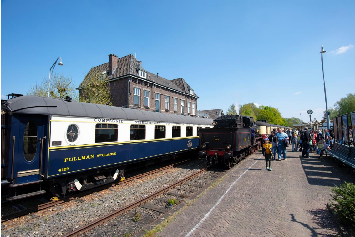
Vertrek vanuit station Simpelveld