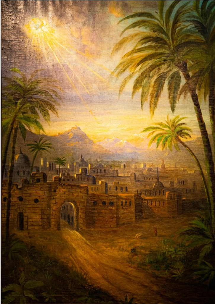
Het schilderij "Gezicht op de Heilige Stad".