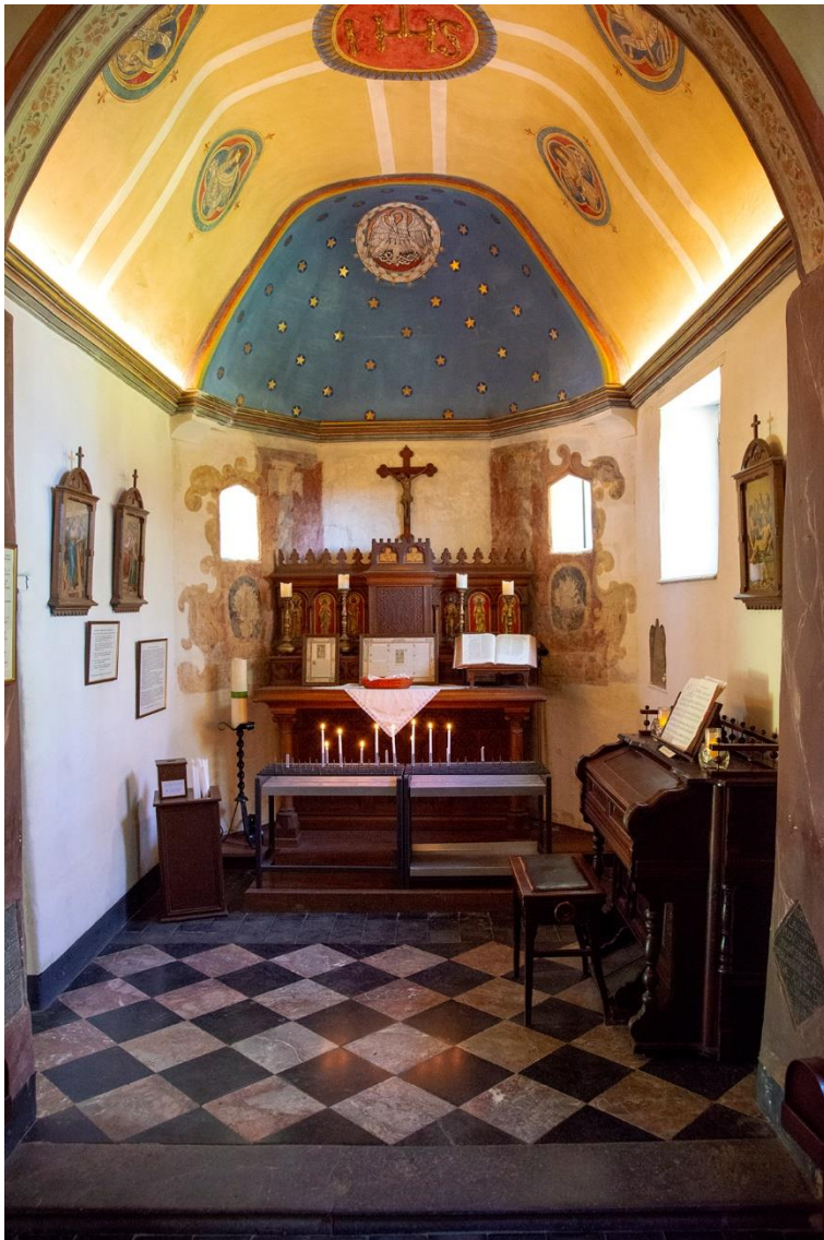
Interieur van de Kapel De Kluis.

Na een bezoek aan dit religieus monument en de daarachter gelegen 'Kruisweg op de Schaelsberg' kunnen we even uitrusten op enkele banken. Van daaruit hebben we een prachtig uitzicht over het Zuid-Limburgse Heuvelland. Direct daarnaast staat een plaquette met toelichting op dat uitzicht.