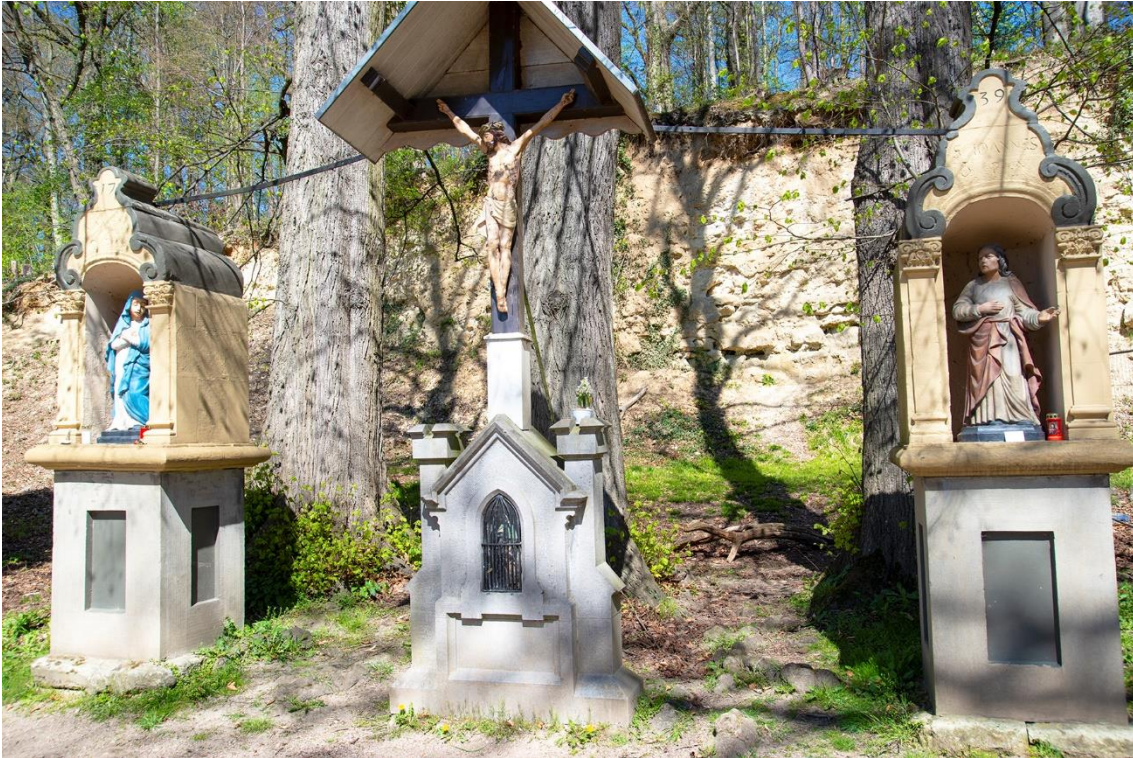
De Drie Beeldjes