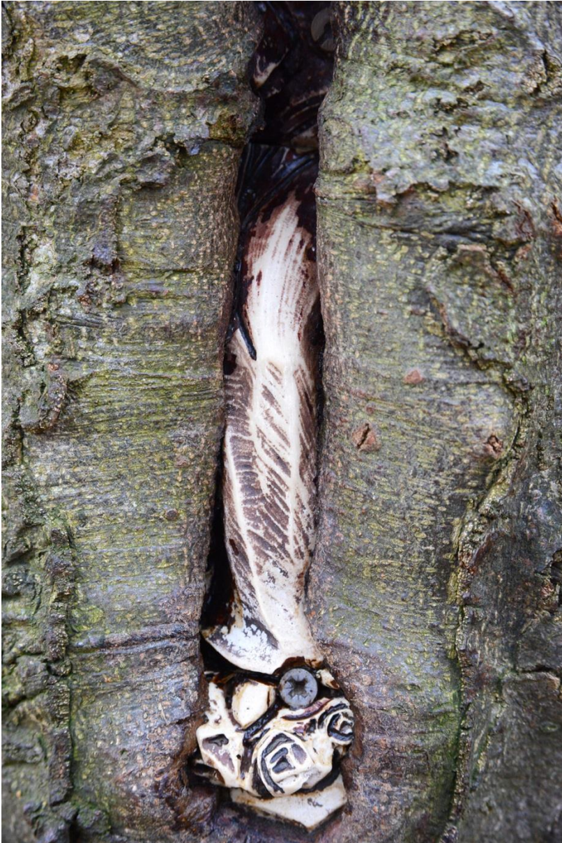
Het ingegroeide Mariabeeldje in 2017.

Na de 'Drie beeldjes' nemen we rechts het pad omhoog. Na de brug over de spoorlijn Heerlen-Valkenburg-Maastricht houden we rechts aan het pad omhoog. Na enige tijd is dan aan de rechterkant het religieuze monument "De Kluis".