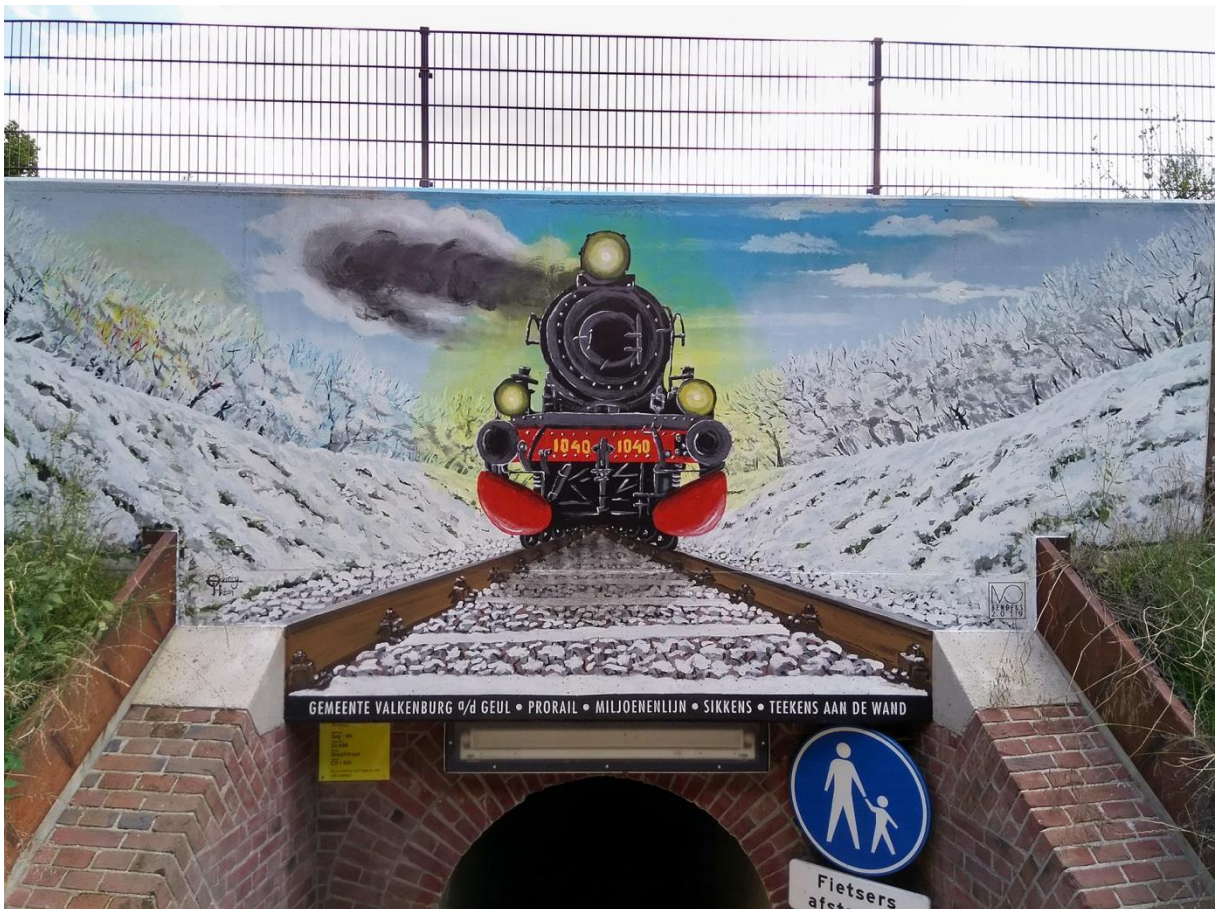
De Mural van de ZLSM op de tunnel onder het 'Miljoenenlijntje'

Het pad gaat nu tamelijk steil naar beneden en komt uit bij een pad langs de spoorlijn. Hier houden we links aan en volgen dit pad tot aan een tunnel onder het spoor door.