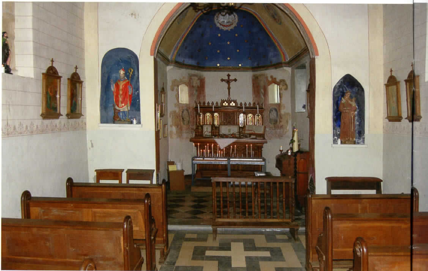
Interieur van de kluiskapel op de Schaelsberg in Limburg

uit een woonkamer, twee slaapkamers en een kelder annex keuken.