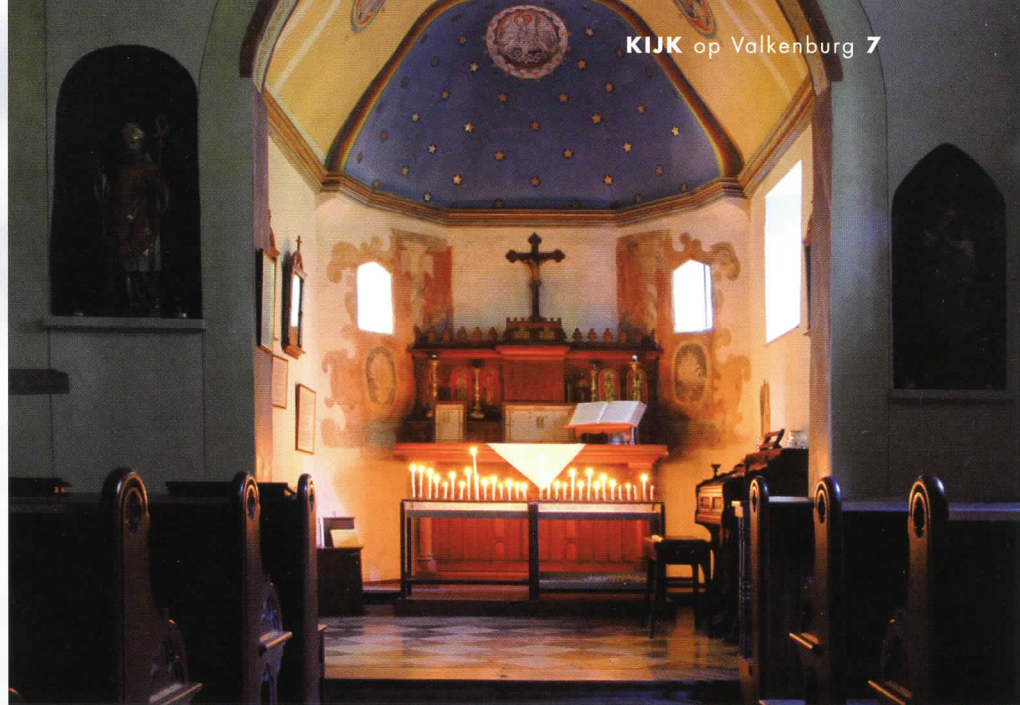
Het kapelletje van de Kluis. Zeker een bezoek waard.